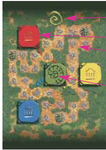
Spielplan für 3 Spieler

Das Heiligtum von Tuchulcha, umgeben von seinem Wald