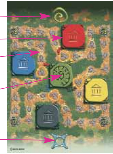
Spielplan für 2 oder 4 Spieler

Heiligtum von Lasa Vecuvia (nur bei 4 Spielern)