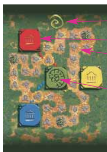
tabellone per 3 giocatori

Il santuario di Tuchulcha, con attorno la sua foresta