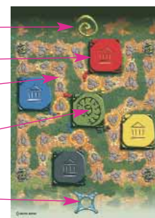
tabellone per 2 o 4 giocatori

Il santuario di Lasa Vecuvia (solo per il gioco in 4)