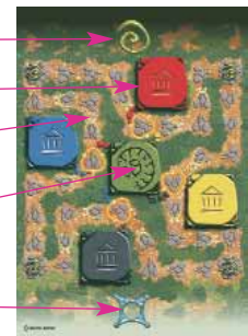
Plateau pour 2 ou 4 joueurs

Le sanctuaire de Lasa Vecuvia (seulement s'il y a 4 joueurs)