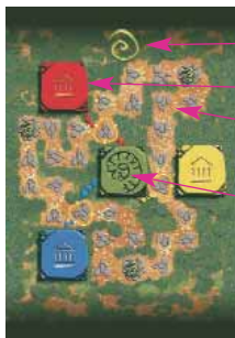
Plateau pour 3 joueurs

Le sanctuaire de Tuchulcha, entouré de sa forêt