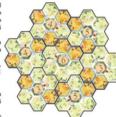
Esempio di disposizione iniziale.

Rimuovete dal gioco schermi, pedine e abitanti non distribuiti.