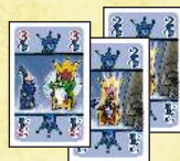
Il giocatore prende!

Quando un giocatore ha di fronte a sé un valore totale di 6 o più, il Re ne ha avuto abbastanza! Quel giocatore deve prendere tutte le carte a faccia in su di fronte a tutti i giocatori, e metterle nel suo mazzetto delle prese, coperte. Indipendentemente da chi ha giocato la carta precedente, è il giocatore che fa la presa ad iniziare la nuova mano, giocando una carta di fronte a uno dei giocatori. Poi il gioco continua in senso orario, al solito.